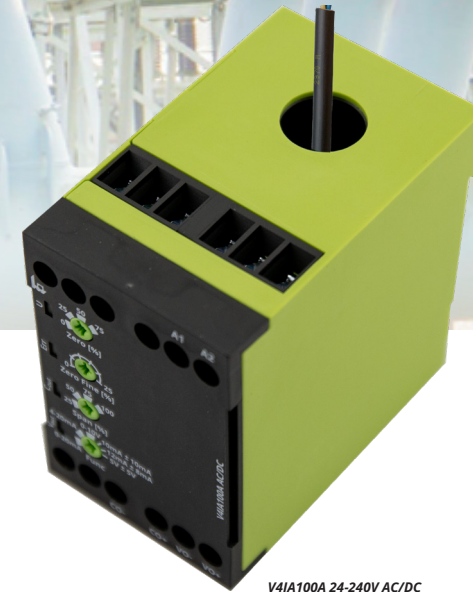
V4IA100A 24-240V AC/DC # 2104420